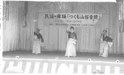
▶撮影奉納／加藤幸男氏