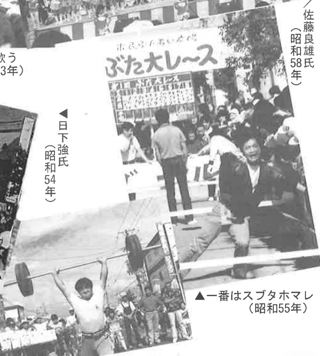
▲ 一番はスプタホマレ (昭和55年)