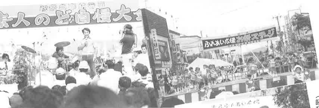
▲ 輪島功一「炎の男」を歌う (昭和53年)