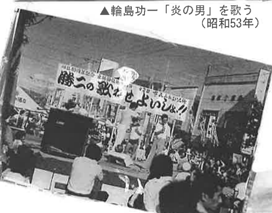
▲ 輪島功一「炎の男」を歌う (昭和53年)