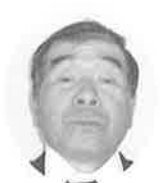
多田 光平 (神社)