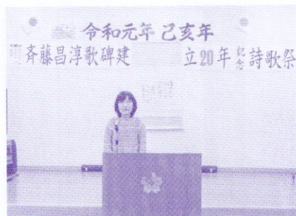
▲撮影奉納／加藤幸男氏